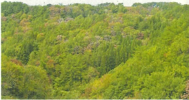
▲青森県の被害地（赤く枯れる）

カシノナガキクイムシ（以下「カシナガ」という）が持ち運ぶ病原菌（以下「ナラ菌」という）により、ミズナラやカシワなどのナラ類が枯死する伝染病です。